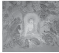
E: 成道 (じょうどう)