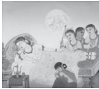
A: 託胎 (たくたい)

※今回ご記入いただきました個人情報は、お申込みの照合のみに使用させていただきます。