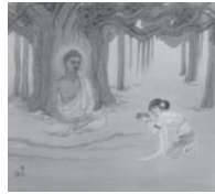
D: 牧女の供養 (もくによのくよう)