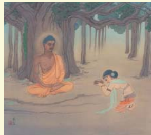
牧女の供養（もくによのくよう）