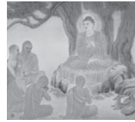
F: 転法輪 (てんぽうりん)