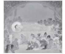
G: 涅槃 (ねはん)