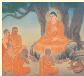
転法輪（てんぽうりん）