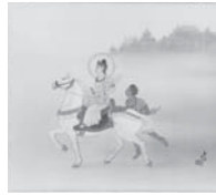
C: 出城 (しゅつじょう)