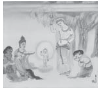
B: 降誕 (ごうたん)